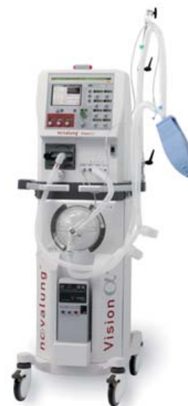
Die Novalung GmbH aus Hechingen erweitert mit dem Beatmungsgerät Vision \alpha sein Produktportfolio um eine Weltneuheit.

quenzbeatmung“ und verweist auf die schonende Therapie, die eine optimale und lungenschonende Beatmung des Patienten ermöglicht. Mit einem kleinen Knopf kann bei Vision \alpha zwischen verschiedenen Beatmungsverfahren gewechselt werden. Das Gerät erlaubt es damit, schnell auf Veränderungen am Patienten zu reagieren und unterstützt die Heilung der Lunge. Vision \alpha ergänzt die Behandlung mit dem iLA Membranventilator, einer künstlichen Lunge, die auf natürliche Weise vom menschlichen Herz mit Blut versorgt wird und außerhalb des Körpers atmet. sr ■